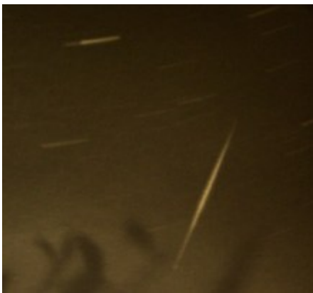
Εικόνες 1,2: Περσείδες του 1996 (φωτογραφική μηχανή με φακό 50mm f/2 και film Ilford XP-2, έκθεση 5min, Λουτράκι)