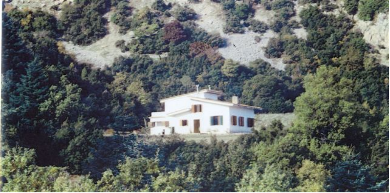
Εικόνα του καταφυγίου (ΟΣΠ) στην Ανάβρα