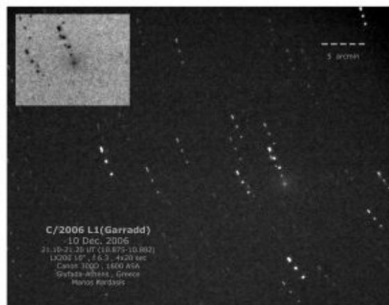
Εικόνα του L1 Garradd στις 10 Δεκεμβρίου 2006, από τον Μάνο Καρδάση.

Ένας άλλος κομήτης ο C/2006 L1 (Garradd) έφτασε το 9ο μέγεθος στο τέλος Δεκεμβρίου (εικ. Μ. Καρδάση 10/12/2006) αλλά πλέον είναι δύσκολα παρατηρήσιμος.