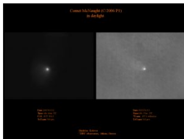
Εικόνα του P1 McNaught στις 15 Ιανουαρίου 2007, από τον Δημήτρη Κολοβό.