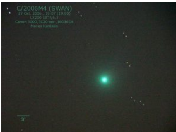
Εικόνα του M4 (SWAN) στις 27 Οκτωβρίου 2006.