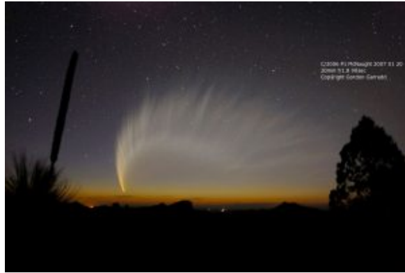
Εικόνα του κομήτη P1 McNaught από τον Gordon Garradd (20/1/2007).

Ένας άλλος κομήτης ο C/2006 L1 (Garradd) έφτασε το 9ο μέγεθος στο τέλος Δεκεμβρίου (εικ. Μ. Καρδάση 10/12/2006) αλλά πλέον είναι δύσκολα παρατηρήσιμος.