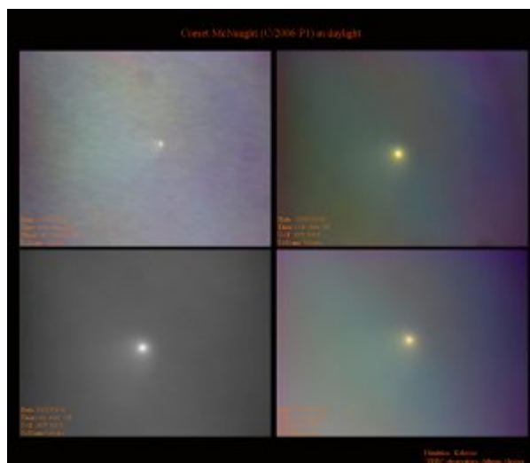
Εικόνα του P1 McNaught στις 16 Ιανουαρίου 2007.