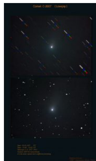
Εικόνα του E2 Lovejoy στις 5 Μαΐου 2007, από τον Δημήτρη Κολοβό.