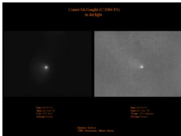
Εικόνα του P1 McNaught στις 15 Ιανουαρίου 2007.