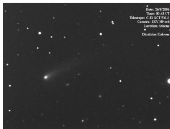
Εικόνα του 4P/Faye στις 26 Αυγούστου 2006, από τον Δημήτρη Κολοβό.

Σε αυτό το μέγεθος κυμαίνεται και ο περιοδικός 4P/Faye αφού έφτασε το 9.5 μέγεθος στις αρχές Νοέμβριου (εικ. Δ. Κολοβού 26/8/2006).