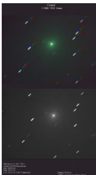
Εικόνα (α) του VZ13 LINEAR στις 12 Ιουλίου 2007.