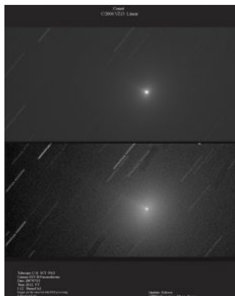
Εικόνα (β) του VZ13 LINEAR στις 13 Ιουλίου 2007.

Οι πιο φωτεινοί κομήτες από τον ουρανό τις Ελλάδας αυτή την περίοδο (τέλος Ιουλίου) είναι οι εξής: