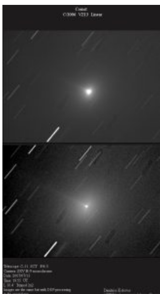
Εικόνα (α) του VZ13 LINEAR στις 13 Ιουλίου 2007.