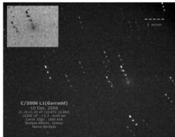
Εικόνα του L1 Garradd στις 10 Δεκεμβρίου 2006.

Ένας άλλος κομήτης ο C/2006 L1 (Garradd) έφτασε το 9ο μέγεθος στο τέλος Δεκεμβρίου (εικ. Μ. Καρδάση 10/12/2006) αλλά πλέον είναι δύσκολα παρατηρήσιμος.