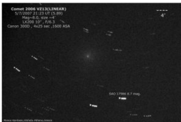
Εικόνα του VZ13 LINEAR στις 5 Ιουλίου 2007, από τον Μάνο Καρδάση.

Στις 13 Νοεμβρίου 2006 από το αυτοματοποιημένο σύστημα LINEAR ανακαλύφθηκε κοντά στο 20 ο μέγεθος ένας άλλος κομήτης που πήρε το όνομα C/2006 VZ13 (LINEAR) . Στις αρχές Ιουλίου έφτασε στο μέγιστο της φωτεινότητας του περίπου στο 7 ο μέγεθος (εικ. Μ. Καρδάση 5/7/2007, εικ. Δ. Κολοβού 12/7/2007 και 13/7/2007).