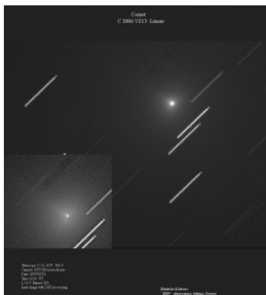
Εικόνα (β) του VZ13 LINEAR στις 12 Ιουλίου 2007, από τον Δημήτρη Κολοβό.