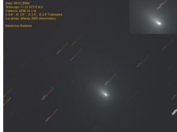
Εικόνα του M4 (SWAN) στις 9 Νοεμβρίου 2006, από τον Δημήτρη Κολοβό.

Σε αυτό το μέγεθος κυμαίνεται και ο περιοδικός 4P/Faye αφού έφτασε το 9.5 μέγεθος στις αρχές Νοέμβριου (εικ. Δ. Κολοβού 26/8/2006).