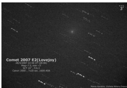
Εικόνα του E2 Lovejoy στις 29 Απριλίου 2007.

Ο 2P/Encke μας επισκέπτεται κάθε 3.3 χρόνια και φέτος στο τέλος Απριλίου έφτασε το 7 ο μέγεθος. Δυστυχώς η παρατήρησή του ήταν πολύ δύσκολη καθώς βρισκόταν χαμηλά στον δυτικό ορίζοντα. Εδώ και περίπου ένα χρόνο ο Terry Lovejoy είχε ξεκινήσει την φωτογραφική ανίχνευση ενός συγκεκριμένου πεδίου του ουρανού κοντά στον ουράνιο ισημερινό με σκοπό την ανακάλυψη κάποιου κομήτη. Το όλο σύστημα περιελάμβανε δυο τηλεφακούς πάνω σε δύο ψηφιακές μηχανές. Η πρώτη ανακάλυψη έγινε στις 15 Μαρτίου 2007 και ο κομήτης πήρε το όνομα C/2007 E2 Lovejoy . Ο κομήτης παρατηρήθηκε από τον Δ. Κολοβό στις 14/4/2007, 15/4/2007, 30/4/2007 και στις 9/5/2007 και από τον γράφοντα στις 29/4/2007. Η μέγιστη φωτεινότητά του έφτασε το 7.5 μέγεθος στις αρχές Μαΐου.